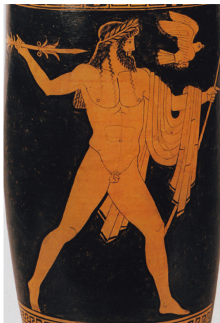
Zeus mit Blitzpfeil und Adler

Bis ins 6. Jahrhundert v. Chr. erklärten sich die Menschen Vorgänge in ihrem Alltag wie Blitz und Donner, Jahreszeitenwechsel, Dürre- oder Regenperioden und Erdbeben mit dem Wirken der Götter. Zu Beginn des 5. Jahrhundert v. Chr. hinterfragten Naturphilosophen diese mythischen Erklärungen und versuchten sie wissenschaftlich zu erklären.